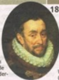
Willem van Oranje

1568- 1648: De Tachtigjarige Oorlog is de naam voor een opstand en strijd in de Nederlanden (met een Twaalfjarig Bestand in de jaren 1609 - 1621). De opstand leidde uiteindelijk tot een splitsing van de Nederlanden in de Noordelijke en de Zuidelijke Nederlanden.