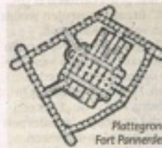
Plattegrond Fort Pannerden

Tussen 1868 -1871 werd het fort op de hoefddam bij Pannerden gebouwd. De belangrijkste taak van het sperfort was, de watertoevoer naar de Nieuwe Hollandse Waterlinie te garanderen.